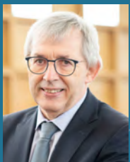
KLAUS KAISER, MDL Parlamentarischer Staatssekretär im Ministerium für Kultur und Wissenschaft des Landes Nordrhein-Westfalen

Denn vor den Ergebnissen der letzten Leo-Studie 2018 können wir uns nicht ausruhen: auch wenn die Zahlen sich geringfügig besser darstellen als in der Vorgängerstudie, gelten nach wie vor rund 6,2 Millionen Erwachsene bundesweit als gering literalisiert. Dieser Befund ist besonders dramatisch vor dem aktuellen Hintergrund der Corona-Pandemie. Durch diese sind Bildungsbiographien zusätzlich empfindlich gestört worden. Bestehende und wachsende Netzwerke des Alphanetz NRW können sich heute als wertvoller denn je erweisen, die Angebotsstruktur landesweit zu stärken, das Thema zu enttabuisieren und in der Öffentlichkeit für lebensbegleitendes Lernen zu werben. Es ist unser gemeinsames Ziel, gering literalisierten Menschen über Alphabetisierung und Grundbildung persönliche, berufliche und gesellschaftliche Teilhabe zu ermöglichen.